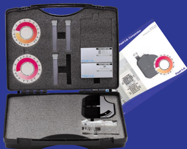
PCK50FD102 Компаратор-набор Water-i.d. pH/Хлор